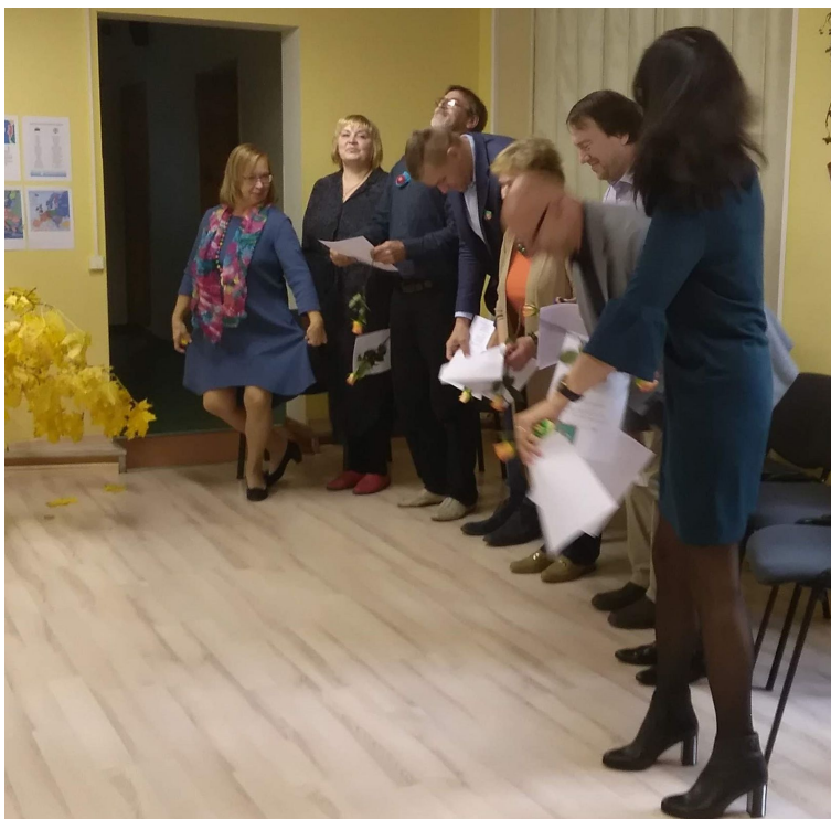
Vallatud õpilased kaapse, knikse ja kummardusi tegemas.

... ja tundi ei pidanudki minema. Selgus, et võisime lihtsalt ümber laua istuda, külalisi vastu võtta, vestelda, kommi ja torti süüa. Kuna kommisaamise ähvardusel oli keelatud töö tegemine, siis tegime ikka pisut koolitööd ka - kes siis kommist ära ütleb. :)